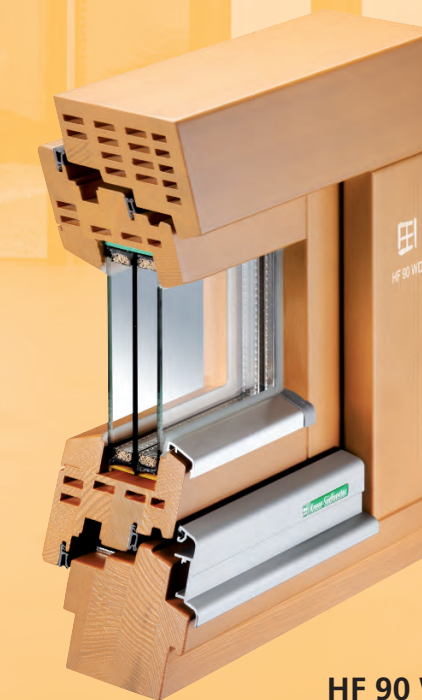
HF 90 WD