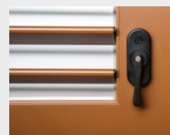
2 Lamellen: feststehend oder von innen verstellbar zur Lichtsteuerung