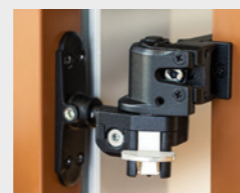
4 Fensterladenhalter: klassische Ausführung zur Fixierung des Fensterladens an der Wand