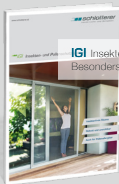
IGI Insekten- und Pollenschutzsysteme. Besonders luftdurchlässig.

Stand 11_2012. Druckfehler, Änderungen und Farbabweichungen vorbehalten.