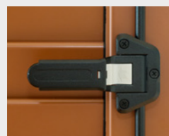
1 Universalverschluss: für einfaches Öffnen und Schließen