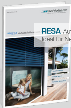
RESA Aufsatz-Rollladen/-Raffstore. Ideal für Neubau.