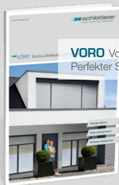
VORO Vorbau-Rollladen/-Raffstore. Perfekter Sichtschutz.