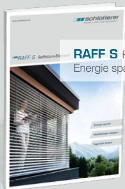
RAFF S Raffstore-Element. Energie sparen.